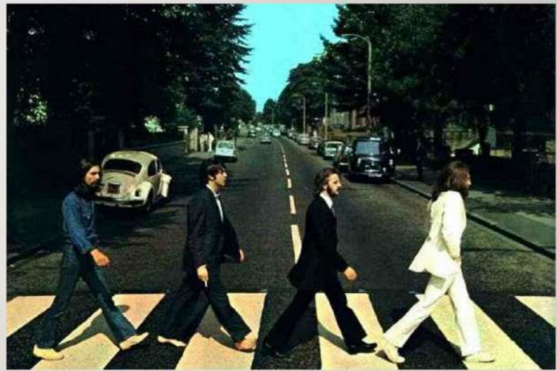
Os Beatles atravessando Abbey Road em Londres-Inglaterra.