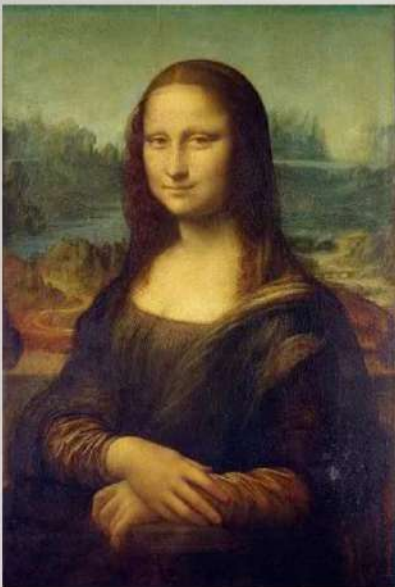
“Mona Lisa”, por Leonardo da Vinci (1503).