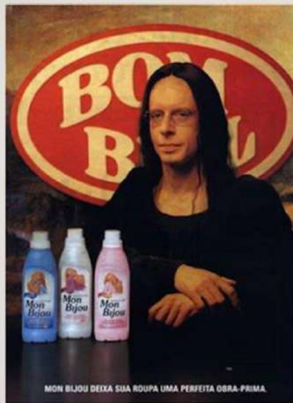
Imagem publicitária da empresa Mon Bijou.

“MON BIJOU DEIXA SUA ROUPA UMA PERFEITA OBRA-PRIMA”.