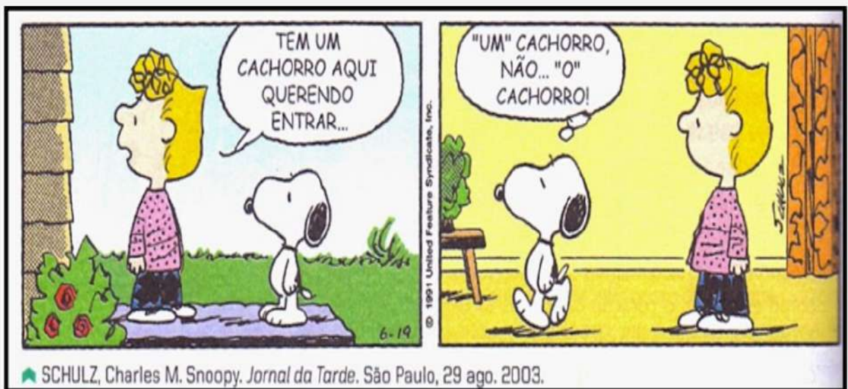
▲ SCHULZ, Charles M. Snoopy. Jornal da Tarde . São Paulo, 29 ago. 2003.