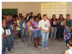
Professores participam de cursos, oficinas, palestras e encontros pedagógicos na busca de formação